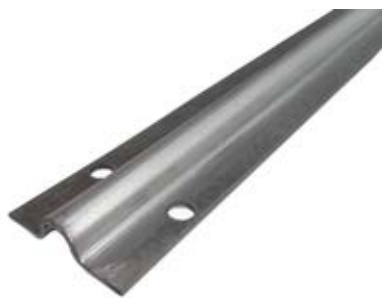
Materiale: Acciaio zincato