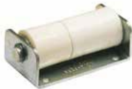
Materiale: Acciaio Zincato