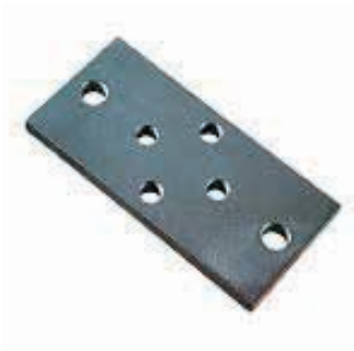
Materiale: Acciaio zincato