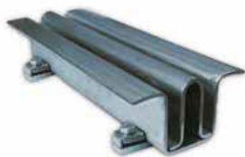
Materiale: Acciaio zincato