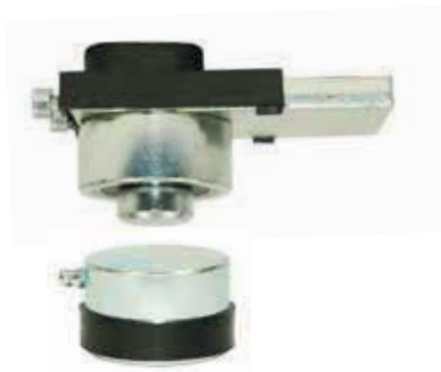
Materiale: Acciaio Zincato / Acciaio Inox