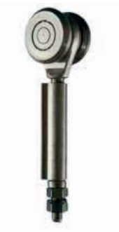
Materiale: Acciaio zincato