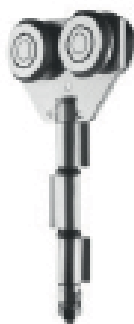
Materiale: Acciaio zincato